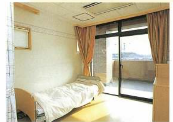
●個室(2・3F) 使いやすい設備とともに、室内 に合わせた壁紙がオシャレです。