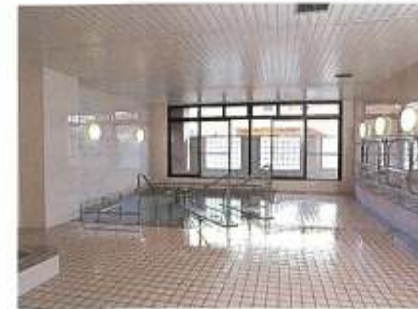
●浴室(1F) 手すりや階段を設けて 安全に配慮しました。