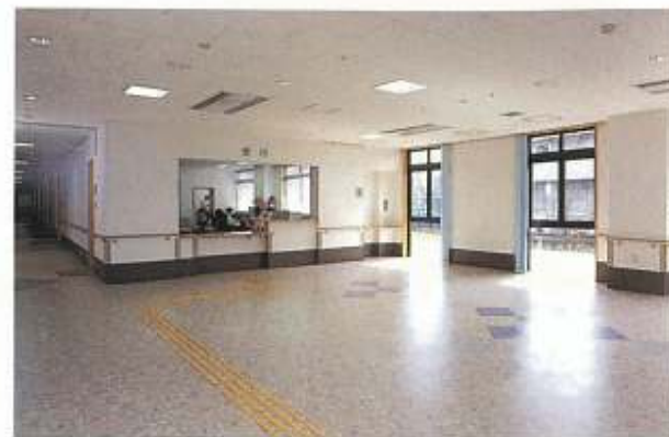
●受付・ロビー(1F) 地域に開かれたハートフル交差点。 スタッフが笑顔でお出迎えます。

入所定員：100名(うち、認知症の方40名) 通所リハビリテーション：34名(デイケア)