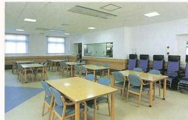
●食堂(1・2・3F) ご家族と共に楽しみいただけます。