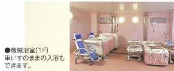
●機械浴室(1F) 車いすのままの入浴も できます。