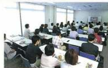
●研修・会議室(1F) ボランティア・勉強会など 利用できます。