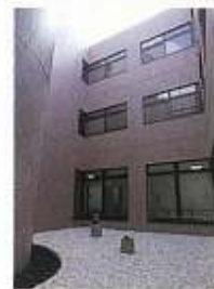
●光庭(1F) 光眩しい中庭では、森のどんぐりと、 ふくろうが迎えます。