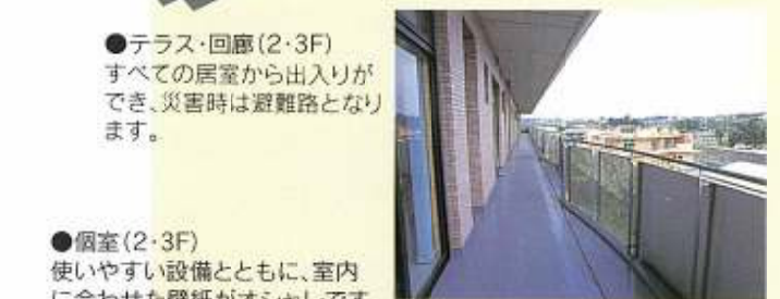
●テラス・回廊(2・3F) すべての居室から出入りが でき、災害時は避難路となり ます。