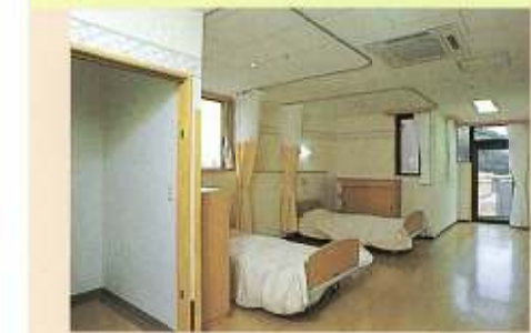
●2人室(2・3F) 二面採光の窓で個室感 を演出し、プライバシーを 尊重しました。