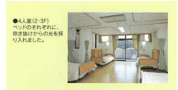
●4人室(2・3F) ベッドのそれぞれに、 吹き抜けからの光を採 り入れました。