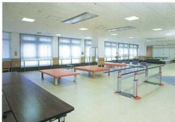
●機能訓練室(1F) 療養生活に応える設備を整えました。